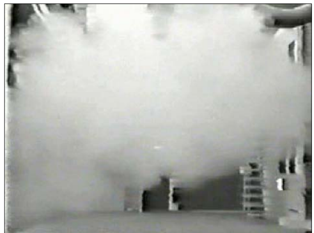
Einstellung Kühlen = Verdrängungsströmung

Bei der Einstellung Heizen wird die Düse geöffnet und die Luft mit erhöhtem Impuls nach unten geblasen.