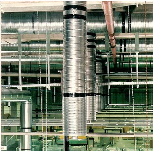
DLD mit Düse, ohne Düsenverkleidung Beispiel: Industriehalle