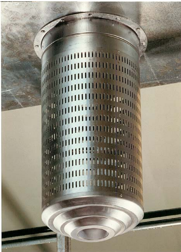
DLD mit Düsenverkleidung